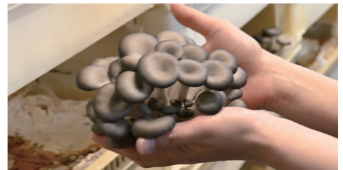
▲桐の里産業(株)のひらたけ