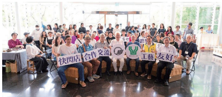
イベントにお集まりいただいた関係者の皆様