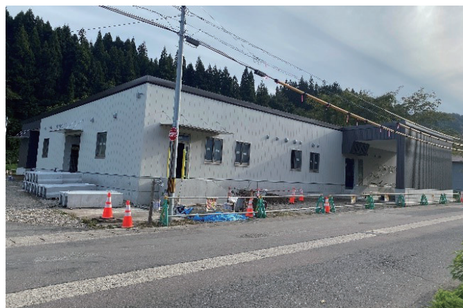
工事状況（施設外観）

本施設の完成により、会津地鶏の処理・流通量の増加や既存商品の他に新たな加工品等の販売ができるようになり、更なる消費拡大が期待されます。