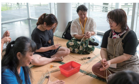
ヒロロの縄ない体験