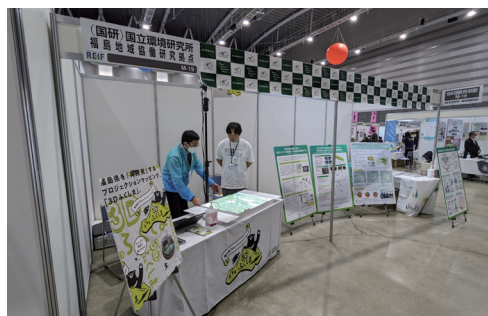
写真『展示会の様子』（国立環境研究所様出展ブース）

今年は、191企業・団体（国の関係省庁、福島県や県内自治体、大学、再エネ関連の民間事業者など）が出展されており、本紙でもお馴染みの「国立環境研究所」様をはじめ町の事業に関係する事業者様も出展されていました。