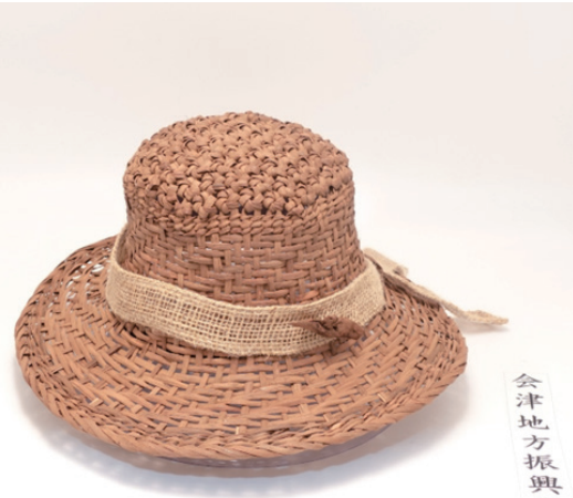
会津地方振興局長賞

同日、生活工芸館で「ものづくり再光展」も同時開催され、東北各地の職人の方々の品々が展示販売されました。