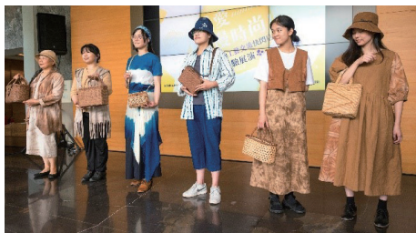
台湾の柿渋、藍染衣装とのコラボ