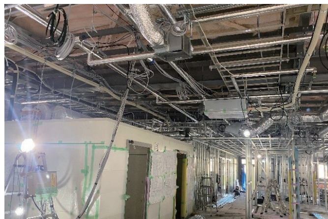
工事状況（施設内部）