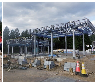
事務所棟・キャノピー設置の様子