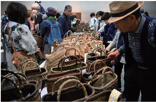
多くの来場者でにぎわった会場