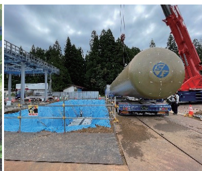
地下タンク設置の様子