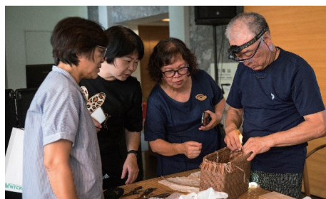
山ブドウ細工の実演