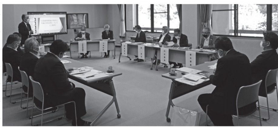
視察に訪れた福島県議会企画環境委員会の皆さん

5月16日、福島県議会企画環境委員会が「只見線再開後の現状と今後の利活用について」の調査のため来町されました。町長や議長が対応し、地域政策課長から現状と課題が説明を受けた後、意見交換が行われました。この視察が只見線を利活用した観光の発展と交流人口の増加につながればと思います。