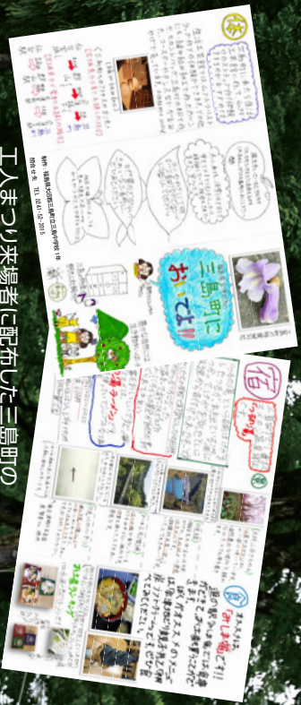
工人まつり来場者に配布した三島町の紹介パンフレット（三島中学生作成）