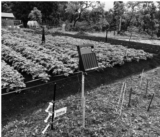
有害鳥獣対策のわな（上）、電気柵（下）

答 産業建設課長 一時的な個体数の減少はあるかもしれないがまだ多いと考えている。