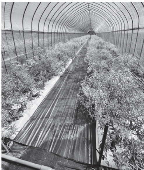
三島町でも一大産業となったカスミソウ栽培

答 産業建設課長 町内の遊休農地の全てを解消することは困難だが、住宅近辺のある農地を有効活用することは大切である。遊休農地の解消が鳥獣対