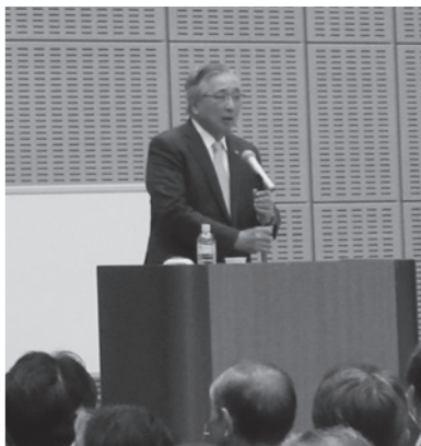
ジャーナリスト 岩田公雄氏講演