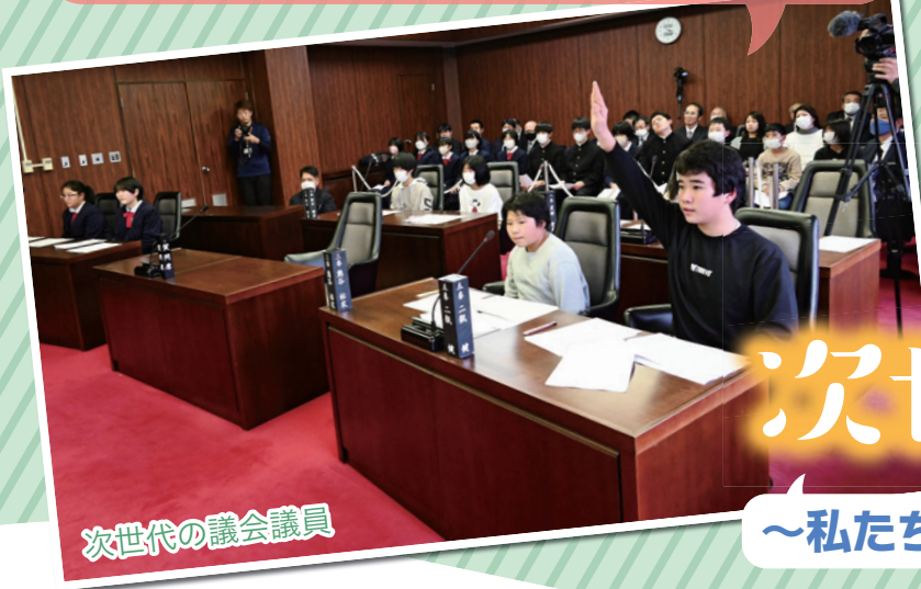
次世代の議会議員