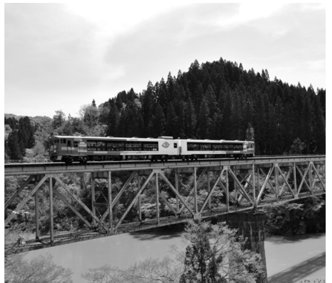
J R 只見線

駅通りを活性化させようと試みているが、令和6年度以降、どのような取り組みを検討されているのか伺う。