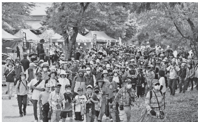
たくさんの方が参加される「桐の里ウォーク」