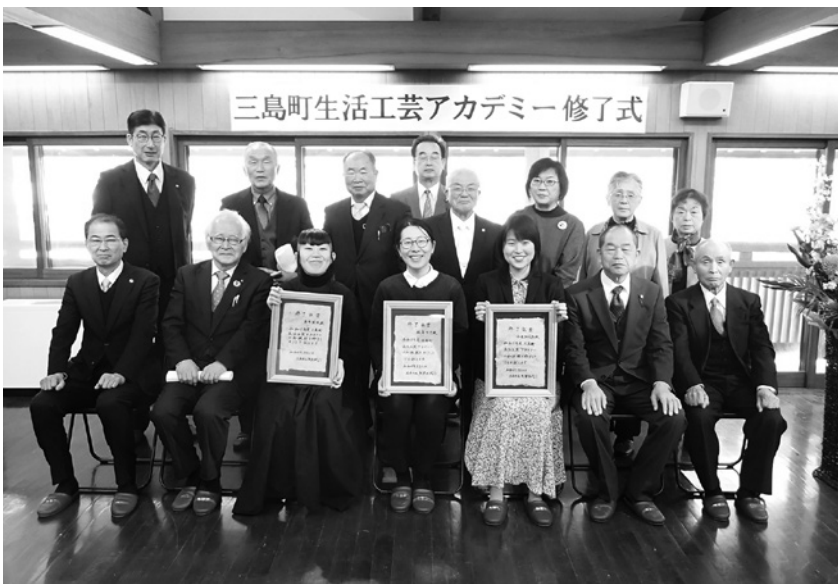
生活工芸アカデミー修了式