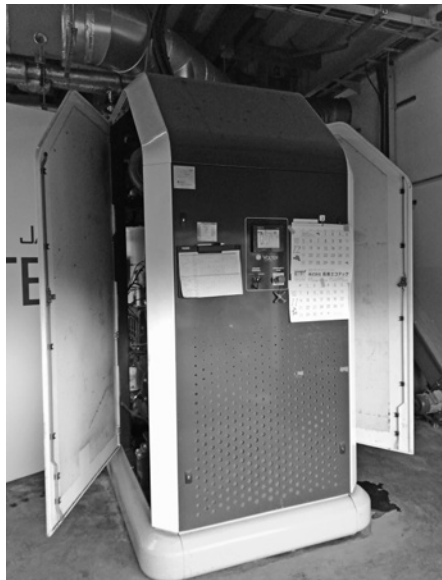
木質バイオマス小型発電設備

問 地域座談会に出席してみると、地区の方々のいら立ちの声が多く聞こえる。町がいう優先順位、検討と