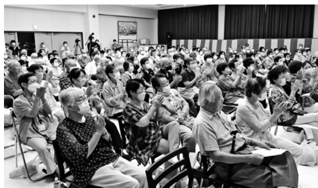
敬老会を楽しまれる皆さん