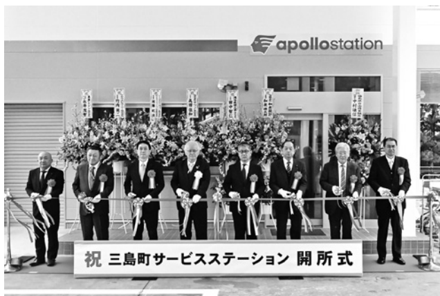
今年度オープンされたサービスステーション