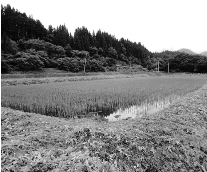
中川井地区の水田

た。これを受けて町では9月1日に中川井集落協定代表、中川井農地保全管理組合代表、受託者の耕作者、桐の里産業農業班、役場産業建設課が出席し、「今後の中川井農地活用に関する検討会」を開催した。その際、揚水ポンプを1/3程の稼働で大谷川からのボ