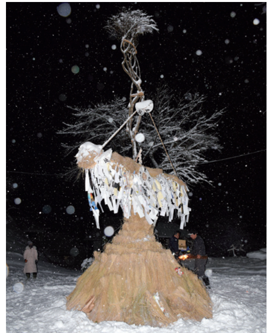
平成20年に国の重要無形民俗文化財に指定を受けた「三島のサイノカミ」

そのためには、観光客を増やして三島町の良いところを広めていく必要があります。三島町のアピールポ