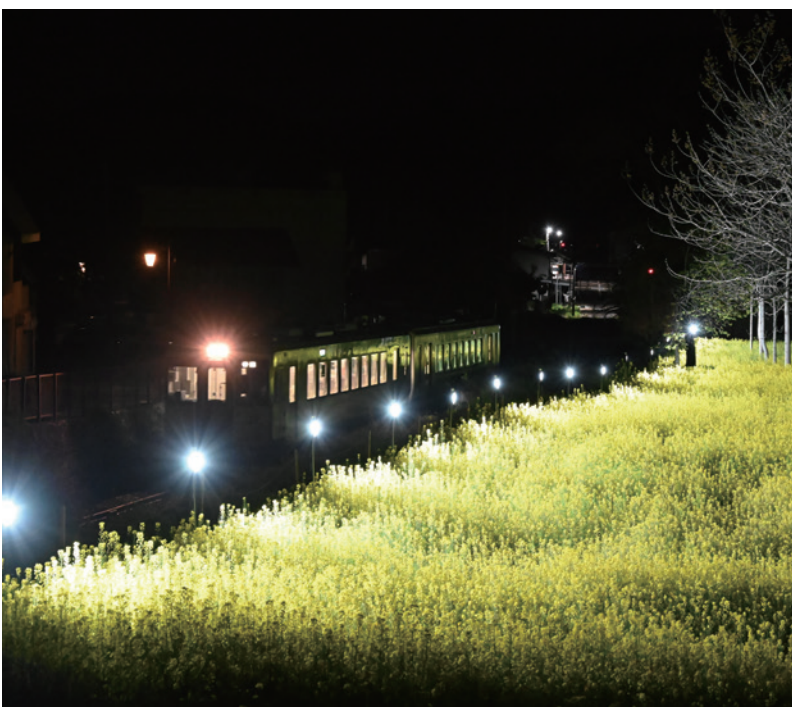
只見線を活用した「菜の花ライトアップ事業」