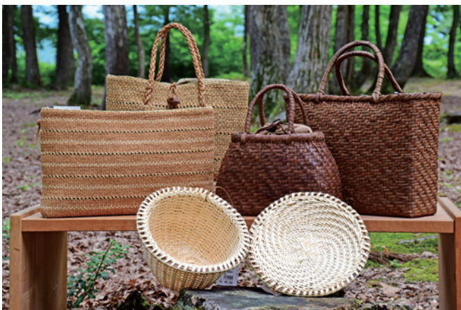
地域の自然素材を生かした奥会津編み組細工

例えば、三島町に住みながら町の生活文化や行事などを、町の方から直接学ぶことができる「三島町工芸