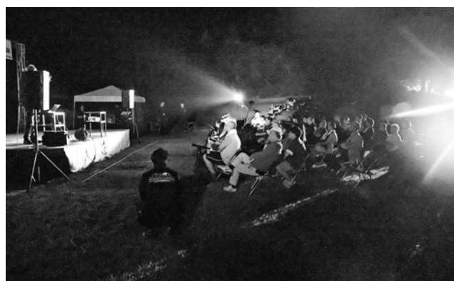
美坂高原での星空活用事業