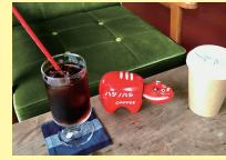
三島町 ハシノハシ [クリームソーダほか]