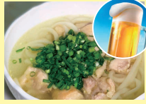
三島町 キッチンMORY [生ビール、地鶏うどんほか]