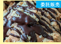
矢吹町 ハッピーベリー [マフィン]