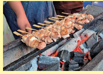
三島町 SampSon [会津地鶏の焼き鳥ほか]