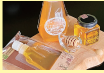
三島町 時任養蜂園 [蜂蜜]