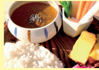
大玉村 大玉カレー [カレー]