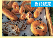
会津美里町 いわなみ家 [自家製天然酵母パン]