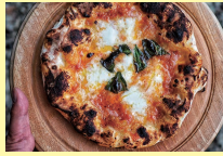
福島市 orioli [天然酵母ピッツァ、クラフトコーラ]