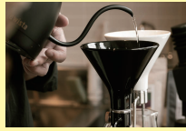
会津若松市 taruga coffee stand [コーヒー、ワイン]