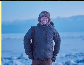
キャンプフォトグラファー 猪俣慎吾氏