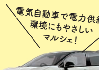
電気自動車で電力供給! 環境にもやさしい マルシェ! 福島日産自動車