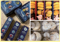
福島市 銀河の森 mommymeow [クッキー缶、焼き菓子]