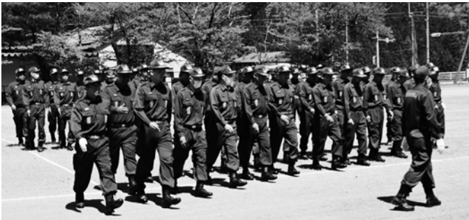
訓練を受ける消防団員

答 地域政策課長 アンケートの対象者206件、回答者154件、回答率75%の中で、物件の登記状況については、回答数93件のうち継続登記されている50件、さ