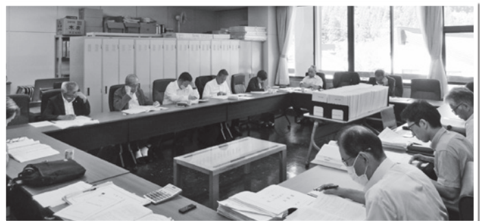
担当者から決算の説明を受ける議員